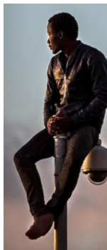
The Gourougou Trial (Netflix)